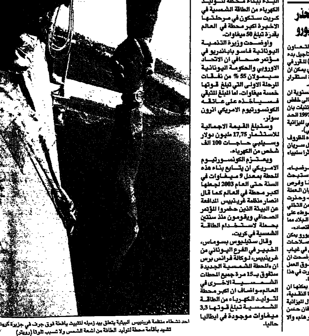
أحد نشاطات منظمة غرينبيس البيئية يتلخص في زبلة لتعبئة حاوية فوق جرف في جزيرة كريت لتعديد باقاة محطة توليد الطاقة من ازمة الشمس ولا تسبب تلوثا (مغنا)

اسلام آباد - رويترز: قالت لجنة التخسيس الحكومية ان كونسورتيوم يترأسه رجل أعمال بونبة الامارات العربية المتحدة تقدم باعلى عرض لشراء بنك حبيب البنكستاني بقيمة 250 مليون دولار.